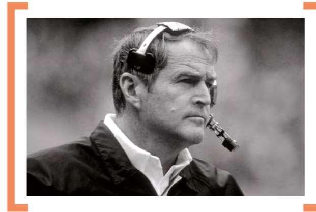
È stato un giocatore e allenatore di football americano. Alla guida dei Pittsburgh Steelers ha vinto 4 Super Bowl. Nel 1993 è entrato nella Pro Football Hall of Fame.

Essendo specializzato in matematica, credevo che tutto fosse uguale alla somma delle sue parti, finché non ho cominciato a lavorare con le squadre. Poi, quando divenni allenatore, capii che il tutto non è mai la somma delle sue parti - è maggiore o minore, a seconda di come riescono a collaborare i suoi membri.